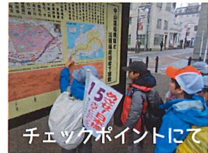
チェックポイントにて